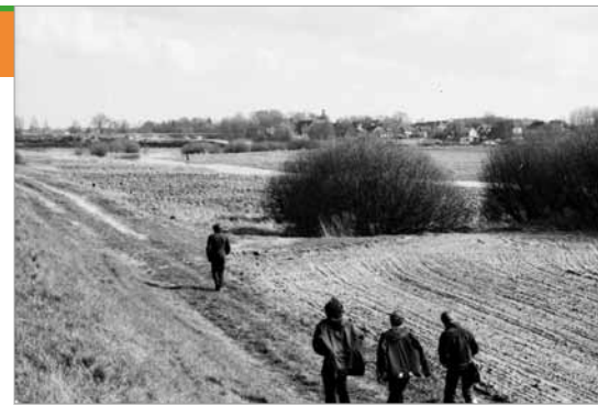
Gartow 1973: noch ohne See

H. Müller in der Elbe-Jeetzel-Zeitung: „Der Gartower See wird in wenigen Tagen um rund 63 000 Quadratmeter größer sein. Die im April begonnene Erweiterung (...) steht kurz vor dem Abschluss. Der Durchstich der Wälle, die jetzt noch die Neuanlagen von dem Gewässer trennen, soll in diesen Tagen erfolgen. (...) Im Westteil des Sees sind insgesamt 200 000 Kubikmeter Erdreich ausgehoben worden. (...) Das entnommene Erdreich dient unter anderem zur Erhöhung der beiden Schachtbereiche auf dem Gelände des Bergwerks zur Erkundung des Salzstockes Gorleben. Eine entsprechende Vereinbarung über die Verwendung des Bodens hatten die Gemeinde Gartow und die Deutsche Ge-