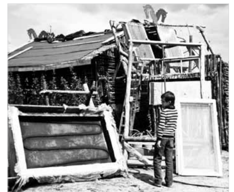
1980: Besetzung der Tiefbohrstelle 1004 in Gorleben; „Solargruppe Dannenberg“

Wer mehr über die Geschichte der KLP erfahren möchte, sollte zwischen Himmelfahrt und Pfingsten auf dem Werkhof in Kukate vorbeischaun, um dort die Ausstellung „Von den Wunde.r.punkten zur Kulturellen Landpartie - eine Dokumentation“ von Michael Seelig zu besichtigen. ✨