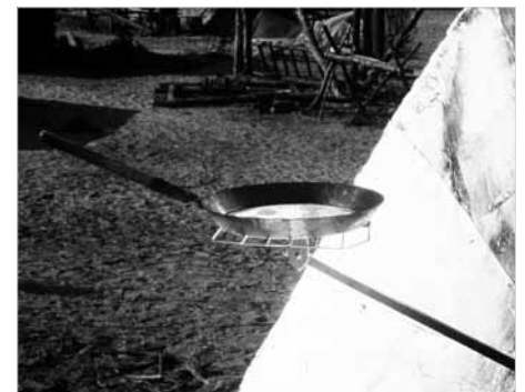
Solarspiegelei, schmackhaft bereits 1980