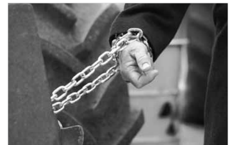
Ankettaktion vor dem Tor des Schwarzbaus; März 2010

Wir stellen uns der Atomkraft in den Weg, zahlreich und entschlossen! Wir sind da, wo sie uns nicht haben wollen! Jetzt oder nie mehr: die Fata Morgana eines „Endlager Gorleben“ wie eine Seifenblase zerplatzen lassen! ✨