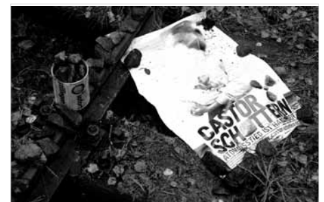
Der Widerstand ist bunt und vielfältig!