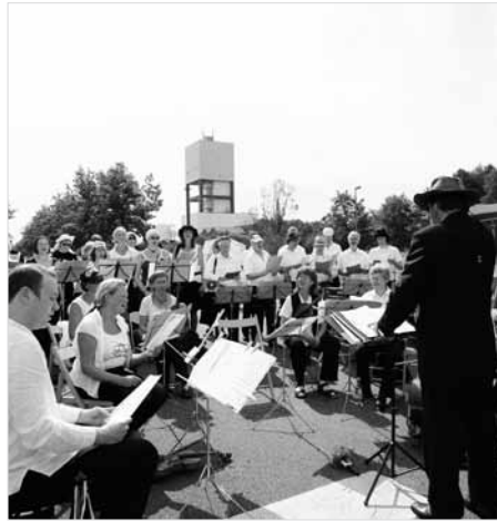
„Musikalische Inspektion“ durch die Aktionsmusiker „Lebenslaute“; Motto: „A-Moll statt A-Müll“ – 2009 Gorleben

Der Schwarzbau Gorleben, das sogenannte Erkundungsbergwerk, das von allen Regierungen herbeigesehnte Endlager Gorleben, ist zu 90 % fertig gebaut. Unter Ausschluss und ohne jede Beteiligung der Öffentlichkeit. Seit November 2010 wird nach zehn Jahren Baustopp kräftig weitergebaut: Per Sofortvollzug des Bundesumweltministers Röttgen, im Drei-Schicht-Betrieb, 24 Stunden an jedem Werktag!