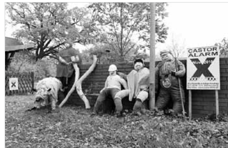
Eine komplette Familie protestiert ununterbrochen in Form von „Stellvertreterpuppen“ in einem Dorf im Wendland.

geht, jeder aber in der Frage der Atomnutzung ständig präsent sein muss. Und auch die Plakataktion „Wir stellen uns quer“, die 1995 im Hinblick auf den ersten Castortransport nach Gorleben startete, stand in einer Beziehung zur KLP, da diese während der 12-tägigen Veranstaltung an verschiedensten Orten präsent waren, um die BesucherInnen auf den Transport aufmerksam zu machen. Und auch in diesem Jahr kann der aufmerksame KLP-Besucher wieder das ein oder andere Plakat finden, sich dieses zu Gemüte führen und dann im November wieder ins Wendland kommen, um gegen den