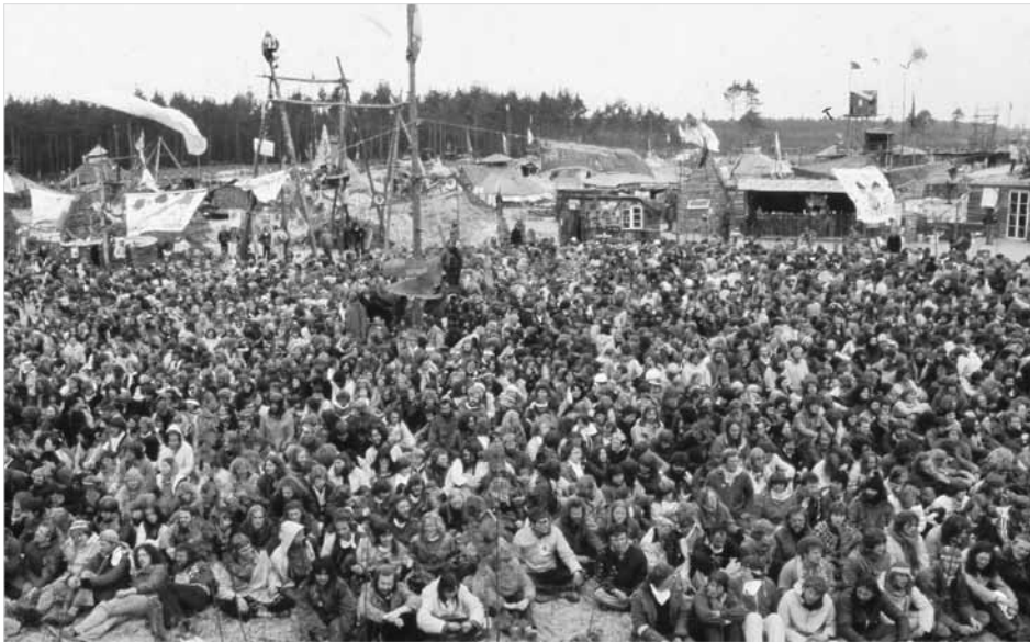
Das Hüttendorf in Gorleben kurz vor der Räumung, 1980