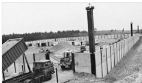
Baustelle Salzbergwerk Gorleben; 1981 das sieht doch schon ganz sicher aus ...

Bei der aktuellen Debatte um die (Un-)Sicherheit von Atomkraftwerken muss auch die Frage nach der (Un-)Sicherheit von Atommülllagerung gestellt und diskutiert werden. Ein entscheidender Punkt ist die Neuerstellung von Sicherheitskriterien für die Atommülllagerung! Denn in jedem einzelnen der 102 Castorbehälter, die in der Leichtbauhalle Gorleben, dem so genannten Zwischenlager, stehen, steckt das 200-fache radioaktive Inventar des kompletten Bergwerkes „Asse“!