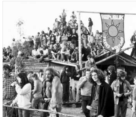
Vor 31 Jahren: Das Protest-Hüttendorf „Republik Freies Wendland“ in Gorleben.

an, mit der sie erbaut war. Göttinger Theologiestudierende hatten dort eine Holzkirche gebaut, in der regelmäßig Gottesdienste gefeiert wurden. Als ich gebeten wurde, zu Pfingsten einen Gottesdienst zu halten, habe ich sofort zugesagt. Die Fragen der Leute auf dem Platz nach unserer Verantwortung gegenüber Gefährdung und Ausbeutung der Umwelt sind auch meine Fragen. Die neue Möglichkeit des Zusammenlebens, die hier so phantasievoll und kreativ versucht wurde, war für mich eine Artikulation dessen, was wir Glauben und Hoffen nennen.