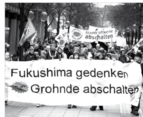
11. März 2012: Circa 7000 Menschen demonstrierten in Hannover für eine sofortige Stilllegung der Atomanlagen weltweit und gedachten der Menschen in Japan/Fukushima.

Anfängliche Skepsis ob der Teilnehmerzahl wich schnell zurück vor einem Meer aus Fahnen und tausenden Menschen, die sich auf dem Opernplatz zum Auftakt der Kundgebung versammelt hatten. Der bewegende Moment des Redebeitrags japanischer Frauen gipfelte in einer Schweigeminute zum Gedenken der Opfer der Katastrophe in Japan. In der Folge gab es Reden kirchlicher und gewerkschaftlicher Vertreter. Die Redebeiträge beinhalteten eine gute Mischung mahnender und kämpferischer Beiträge und auch das musikalische Rahmenprogramm konnte sich gut in die Stimmung einfügen. So konnte die Veranstaltung getragen durch die Breite der Gesellschaft, ihrer mahnenden Intention voll gerecht werden. Der BI Hannover gelang mit dem Aufbau der Veranstaltung ein kraftvolles Zeichen gegen eine menschenverachtende Form der Energiegewinnung. Persönlich konnte ich ein hohes Maß an Energie mit nach Hause nehmen, die mich und hoffentlich alle Mitstreiter wieder ein großes Stück unserem Ziel entgegen tragen werden : Alle Atomanlagen abschalten, weltweit! *